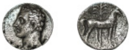
36. CARTAGONOVA. Sículo. A/Cabeza viril a izq. R/Caballo parado a dcha; detrás palmera con frutos. C-64, V-7.2. 7,16 g. Plata pica-da habitual de éstas emisiones. Buen ejemplar. MBC+ 350