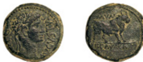
46. ERCAVICA. As. Augusto. Toro a dcha. en rev. con rabo vert. AB-1278. 16,30 g. Pát. verdosa. MBC 150