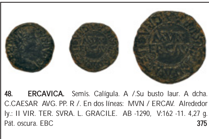
48. ERCAVICA. Semis. Calígula. A /Su busto laur. A dcha. C.CAESAR AVG. PP. R / . En dos líneas: MVN / ERCAV. Alrededor ly.: II VIR. TER. SVRA. L. GRACILE. AB -1290, V:162 -11. 4,27 g. Pát. oscura. EBC 375