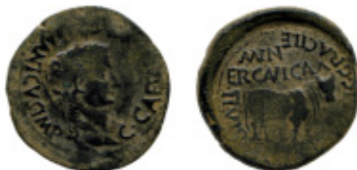
47. ERCAVICA. As. Calígula. AB-1286. 14,06 g. Pát. oscura. Ligera falta de presión. MBC- 100