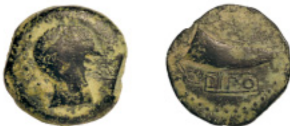
39. DIPO. As. C-1. 27,31 g. Pát. verdosa. ESCASA (MBC) 250