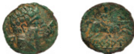
27. BURSAU. As. A /. Cabeza v. a dcha. Delante delfín, detrás letra ib.: "BU". R/. Jinete lancero a dcha. Debajo ly.ib.: "BURSAU". 10,13 g. Pát. Verde. C-4. MBC+ 175