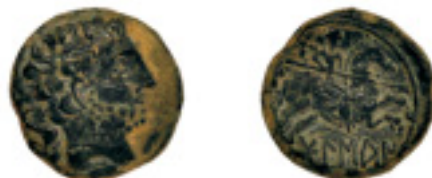
25. BOLSKAN. As. C-4 (vte. por travesaño de la letra ib.: KA al revés) 8,15 g. Pát. verde. EBC- 125