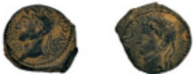
31. CAESARAUGUSTA. Semis. Tiberio. AB-374, V-173.12. 4,54 g. Pát. verde. Cospel irregular. RARA. (MBC+) 175