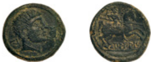
20. BILBILIS. As. C-14. 12,13 g. Pát. verdosa. Tipo peculiar. MUY ESCASA. MBC+/MBC 150