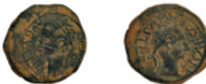
30. CAESARAUGUSTA. Semis. Tiberio. AB-373. 7,37 g. Raya en anv. Leve despl. Difícil en esta conserv. (EBC-) 225