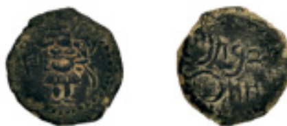
41. EBUSUS. Semis. Letras " aleph" y "zayin" a izq. de Bes. C-61. 5,14 g. Pát. oscura. MBC+ 50