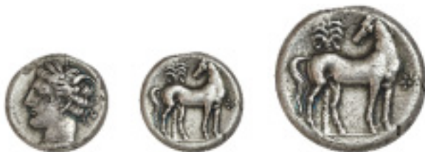
37. CARTAGONOVA. Sículo. A/Cabeza de Tanit a izq. con dos espigas en el peinado. R/Caballo parado a dcha; con cabeza vuelta, detrás palmera, delante estrella de ocho radios con punto central. 7,35 grs. C no cita AB no cita. MBC+ 1.750