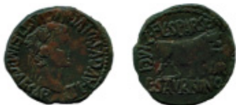
34. CALAGURRIS. As. Tiberio. AB-429. 10,74 g. Pát. verdosa. MBC+ 200