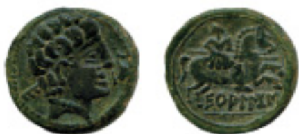
45. EKUALAKOS. As. C-2, AB-969. 12,01 g. Pát. verde. MBC+/EBC- 200