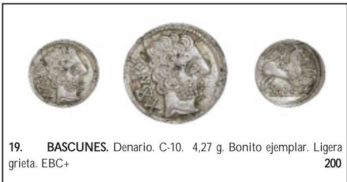
19. BASCUNES. Denario. C-10. 4,27 g. Bonito ejemplar. Ligera grieta. EBC+ 200