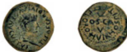
26. OSCA. Semis. Tiberio. AB-1938, V-137.4. 6,52 g. Pát. verde. Rara así. MBC+ 250