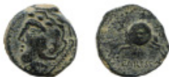
35. CARISA. Semis. C-6. 5,52 g. Pát. verdosa. MBC 70