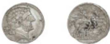
23. BOLSKAN. Denario. C-6. 3,90 g. EBC- 125