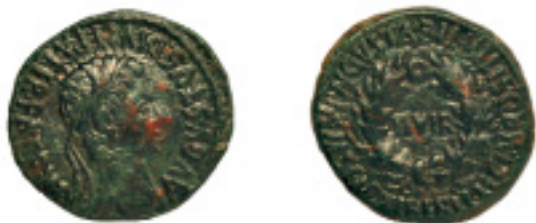
21. BILBILIS. As. Augusto. AB-278. 11,51 g. Pát. verde. EBC- 200