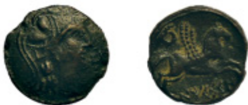
43. EMPORION-UNTIKESKEN. As. A/Cabeza de Palas a dcha; delante ly. ib.: "EBA". R/Pegaso a dcha. Láurea sobre grupa; debajo, sobre línea, ly. ib.: "(U)NTIKESKEN". C-69. 12,22 g. Pát. negra. ESCASA. MBC+ 120