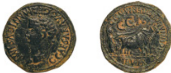
28. CAESARAUGUSTA. As. Calígula. AB-391. 12,04 g. Pát. oscura. MBC+ 250