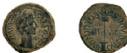
29. CAESARAUGUSTA. Semis. Augusto. AB-334. 6,22 g. Pát. verde. EBC- 150