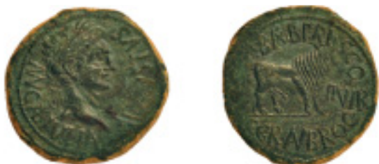
33. CALAGURRIS. As. Augusto. AB-416 (Vte. CAL por CL). 13,09 g. Bonita pát. verde. Leve faltra de presión en ly. del anv. (4 h). (EBC-) 275