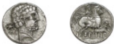
22. BOLSKAN. Denario. C-6 (Vte. de anv.) Tipo diferente a los de Jenkins y Palenzuela. 4,13 g.. MBC+/EBC- 125