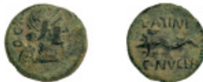
38. CARTEIA. Semis. C-62, AB.-678. 5,61g. Pát. Verde.Difícil en esta conservación. (EBC) 300