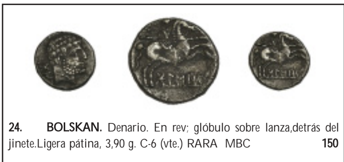
24. BOLSKAN. Denario. En rev; glóbulo sobre lanza, detrás del jinete. Ligera pátina, 3,90 g. C-6 (vte.) RARA MBC 150