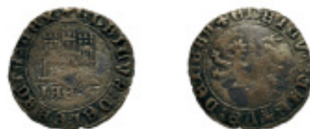
190. MARAVEDÍ. ENRIQUE IV. Jaen. IAEN debajo del castillo. ABM-797 (vte.). Sin granadas debajo del león. RARA. MBC- 90