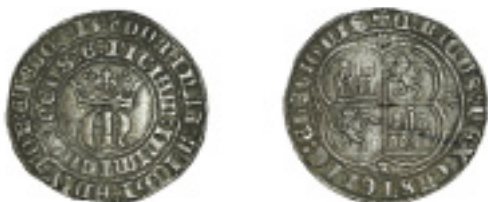
183. 1 REAL. ENRIQUE II. Toledo. T debajo de escudo cuartelado. ABM - 407. MUY ESCASA. MBC+/EBC- 300