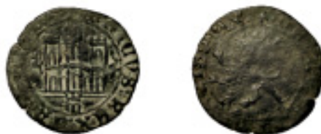
191. MARAVEDÍ. ENRIQUE IV. Madrid. M coronada debajo del castillo con ramas de granado a los lados. ABM-799.1. RARA. MBC- 125