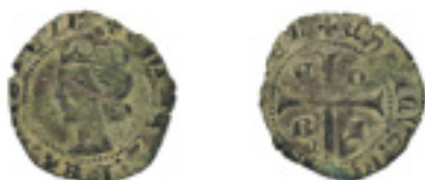
185. CRUZADO. ENRIQUE II. Cuenca. Vte. de letras en el cuartelado. B por R en tercer cuartel. Marca de ceca: C gótica bajo B en tercer cuartel. RARÍSIMA. MBC 300