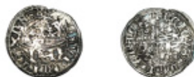
189. 1/2 REAL. ENRIQUE IV. Segovia. Acueducto debajo del escudo. ABM-725 (vte.). MBC 80