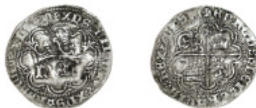
188. 1 REAL. ENRIQUE IV. Sevilla (HEN) S arriba, castillos y leones intercambiados. ABM no cita. Dos picotazos en anv. MUY RARA. MBC- 250