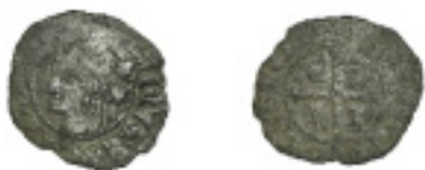
186. CRUZADO. ENRIQUE II. Villalón. V detrás de cabeza. ABM-476. RARA. BC+ 80